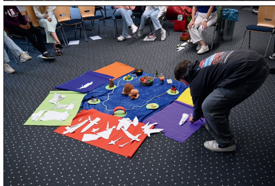
Abb.: Gesine Kleinwächter mit den Schülerinnen und Schülern der 5. Klassen.