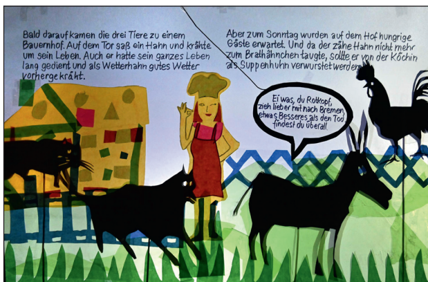
Abb.1–5: Bastelarbeiten der Kinder © Patricia Thoma.