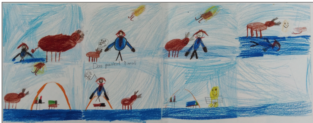
Abb.: Eines von vielen Bildern, das von den Kindern zu den Märchen gestaltet wurde.

Am Ende hatte jede Klasse eine Präsentation. Einige Kinder waren in der Lage, längere Abschnitte zu erzählen, andere Kinder sprachen einige Sätze gemeinsam im Chor, sodass alle Kinder an der Präsentation beteiligt waren.