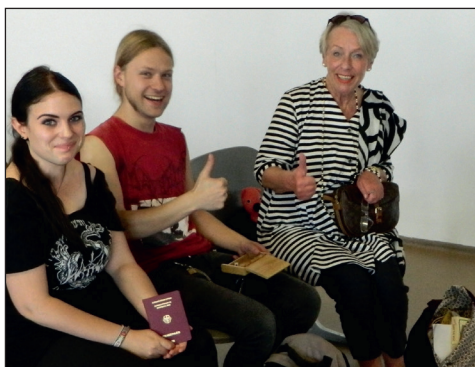
Abb. 6: Ihren berühmt-berüchtigten „Märchenoptimismus“ behielt sie auch bei Schlafmangel und Reisesträpazen – hier am Flughafen während der Georgienreise im August 2014.

chen – das man, wie sie augenzwinkernd betonte, eigentlich nicht verraten sollte – war das Rumpelstilzchen . Sie liebte dessen eigentümlichen Tonfall, die verschrobene Komik der Figur und die Art, wie das Märchen mit Sprache spielt und ferner natürlich, dass man daran alle wichtigen Märchenmerkmale hervorragend zeigen könne. Ähnlich vergnügt äußerte sie sich auch über die Bremer Stadtmusikanten , das moribunde, aufmüpfige Rentnerkollektiv, mit dem sie sich mit ihrem Sinn für Selbstironie gerne das ein oder andere Mal identifizierte. Es sind auch solche Eigenheiten, die im Gedächtnis bleiben und sie zu mehr als einer rein akademischen Lehrperson zwischen Wissenslust und Wissensdurst machten.