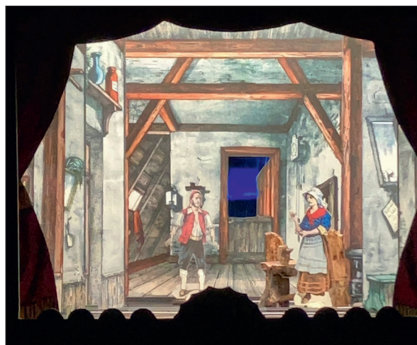
Abb.: Auszug aus der Papiertheaterbühne Bamberg am Abend des 17.9.25