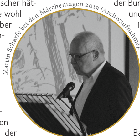
Martin Scharfe bei den Märchentagen 2019 (Archivaufnahme).

1981 erfolgte die Habilitation an der Universität Tübingen. Auf den Fachkongressen war Martin Scharfe mit eigenen Plenarvorträgen und in den Debatten präsent. Zusammen mit Gottfried Korff redigierte er lange Zeit den Aufsatzteil der Zeitschrift für Volkskunde. 1985 nahm er den Ruf auf eine Professur am Institut für Europäische Ethnologie an der Universität Marburg an; 1986 ging er für eine Gastprofessur nach Stockholm, wo er die