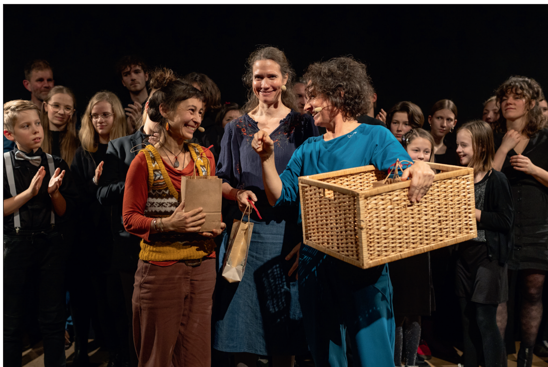
Abb.: Narrare 2024 © Tina Peißker.

Bei diesen Veranstaltungen wurde im Tandem erzählt: Deutsch/Italienisch, Deutsch/Arabisch, Deutsch/Belgisch. Wobei das Thema Wasser eine zentrale Rolle spielte. So improvisierten beispielsweise Antje Horn und Tom van Mieghem