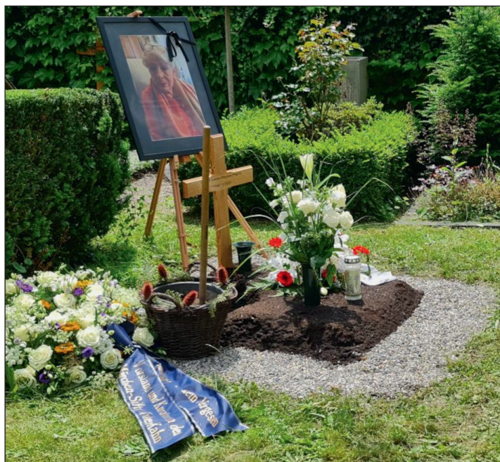
Abb. 8: Ein letzter Gruß zum Abschied, zur Urnenbeisetzung am 10.6.2025 auf dem Friedhof in Freiburg i. Br.