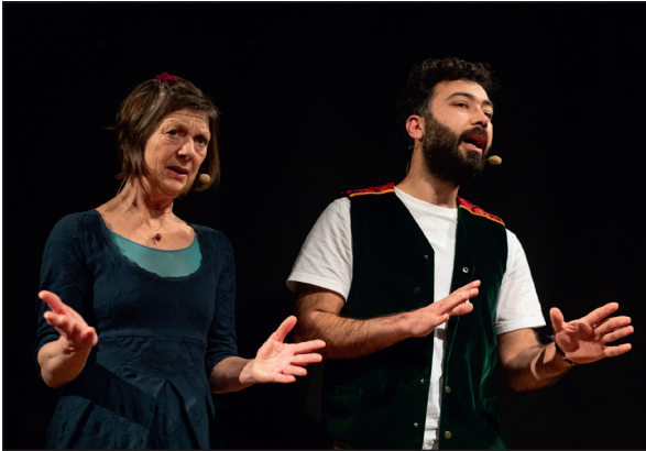
Abb.: Narrare 2024 © Tina Peißker.

ein Märchen über einen Jungen, der zur See fahren will, sich ein Schiff aus einem Stuhl baut und auf dem Ozean eine Möwe trifft, die ihm von den Gefährdungen des Meeres berichtet.