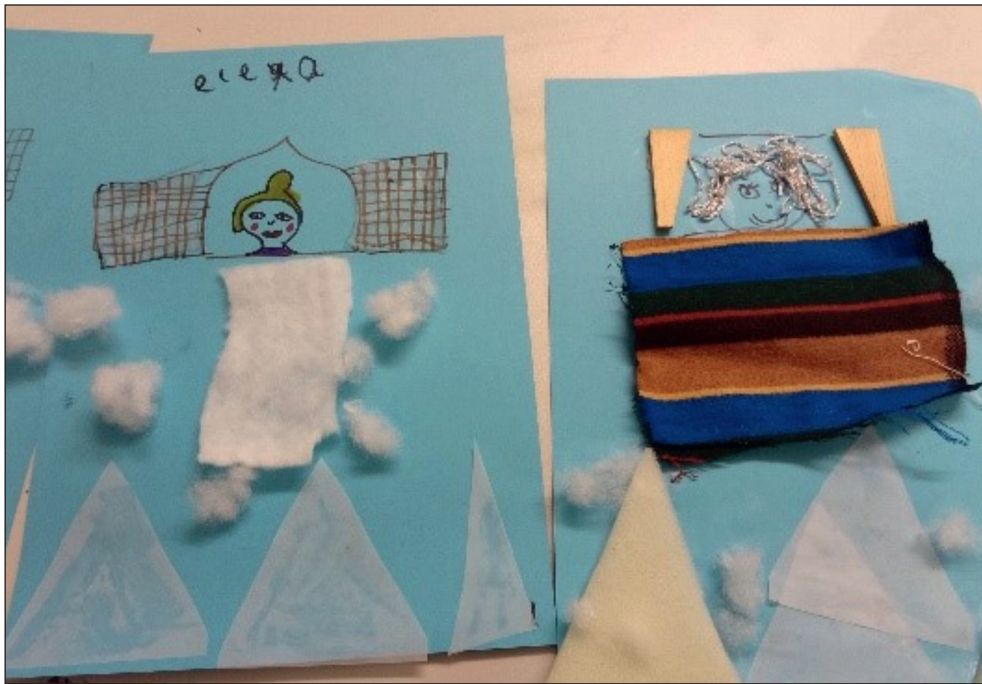
Abb. 1 bis 4: Einige Ergebnisse aus den Kreativstationen.