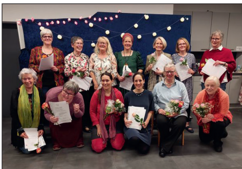
Abb.: Gruppenfoto der Teilnehmerinnen und Dozentinnen am Abschlussabend.

Die Teilnehmerinnen äußerten sich mehrfach anerkennend zu Konzept und Aufbau des Kurses und waren mit ihrem Lernergebnis äußerst zufrieden. Eine der Teilnehmerinnen war von unserem Konzept und der Betreuung durch die Dozenten so begeistert, dass sie sich beim Vereinsvorstand nochmals mit einem begeisterten Schreiben für die Arbeit des Märchenkreises bedankte.