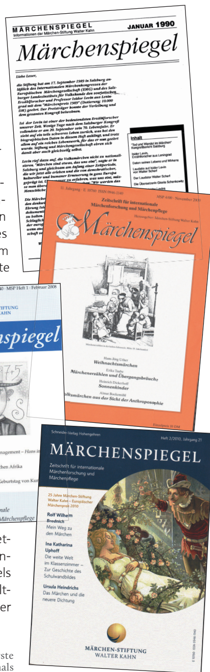
Abb.: Der Märchenspiegel im Wandel der Zeit ... Die erste Märchenspiegel-Ausgabe erschien im Januar 1990, damals noch halbjährig, ab 1993 dann quartalsweise. Bis 2004 wurde das Heft im A4-Format publiziert, später etwas kompakter. Das aktuelle Layout wird seit 2010 fortgeführt.

Ferner möchten wir auf unseren Internetauftritt unter www.maerchen-stiftung.de hinweisen, der einige Bereiche des Märchenspiegels aufgenommen hat, sowie auf die übrigen erhältlichen Zeitschriften wie das Märchenforum der Mutabor Märchenstiftung.